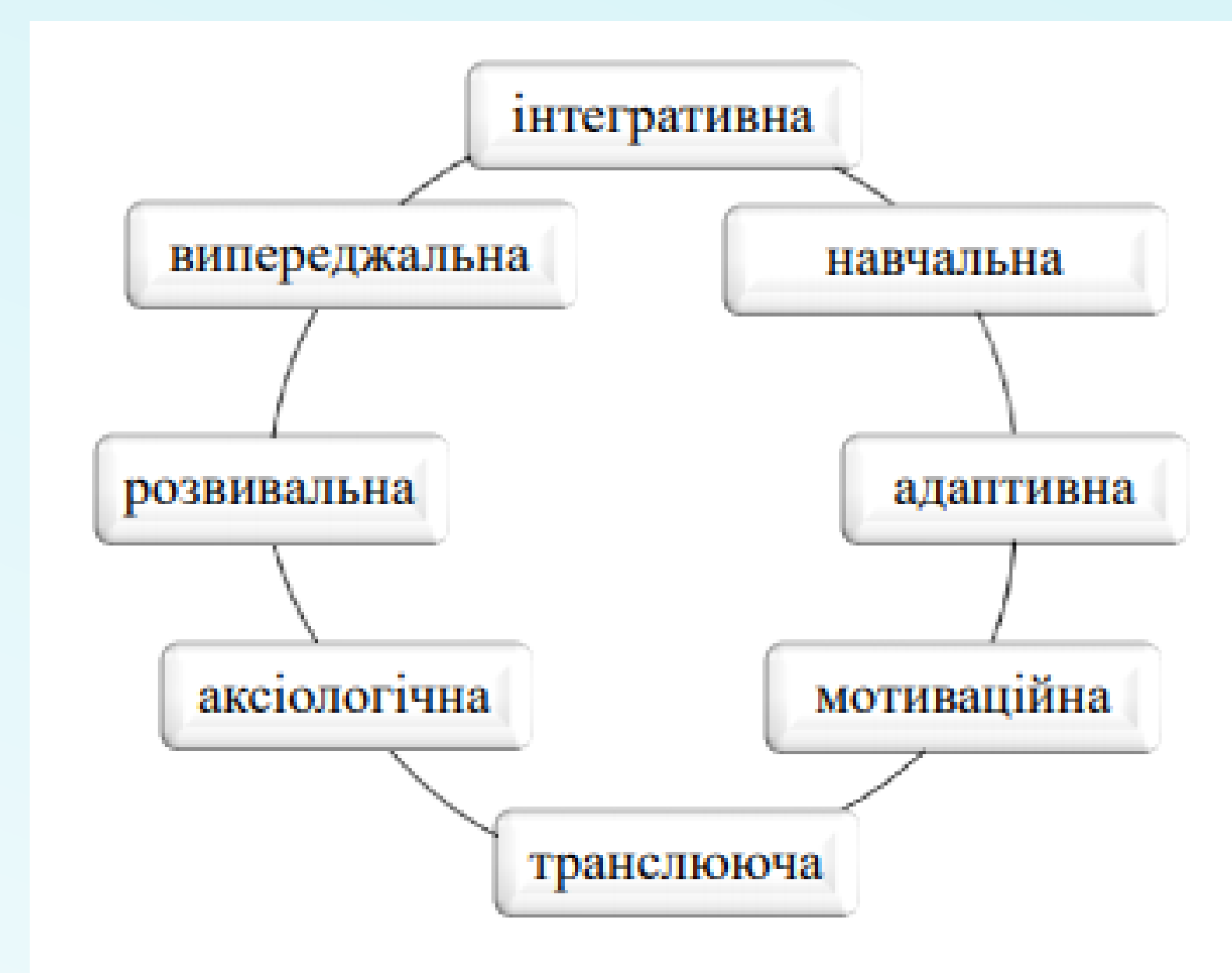
Функції корпоративної освіти