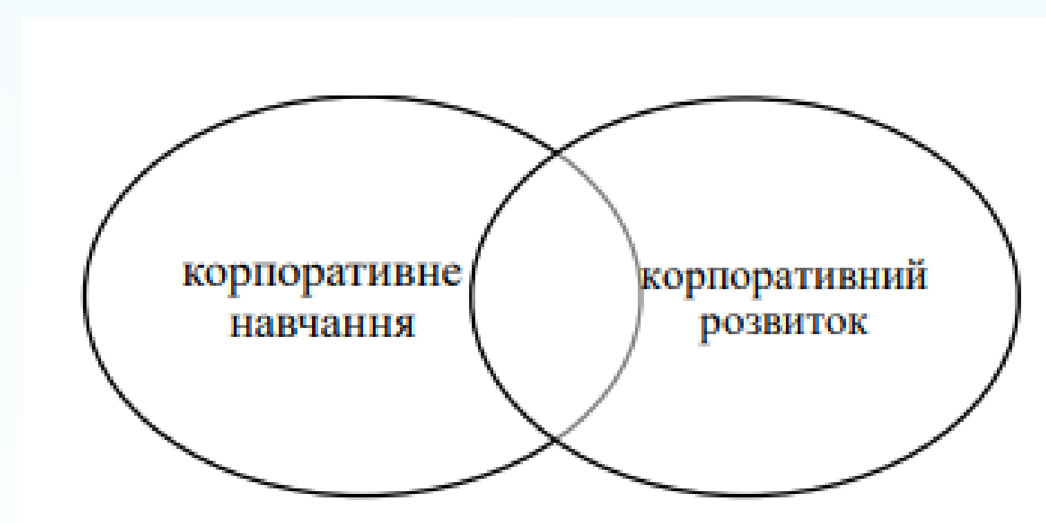
Структура корпоративної освіти